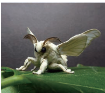
1 雄カイコガ ( Bombyx mori ) Adult male silkworm ( Bombyx mori )

Genetic tools are necessary for promoting our understanding of neural circuits in the brain. We are examining molecular and neural mechanisms that underlie the generation of adaptive behavior using silkworms by employing transgenic and genome editing techniques, which allow us to visualize and monitor the activities of a specific subset of neurons, and to manipulate neuronal activity in intact animals. Furthermore, we have succeeded in reconstructing the functions of several insect-derived odorant receptors in cultured insect cells and olfactory receptor neurons of silkworms through genetic engineering. Insects have highly sophisticated olfactory system that detects odorant molecules in the air with high sensitivity and translate odor information into adaptive odor-tracking behaviors. By applying these technologies, we aim to develop a "cell-based sensor chip" for detecting various odors as a fluorescent pattern of transgenic sensor cells, and a "sensor moth" for finding the source of a specified odor on demand.