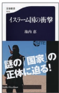
1 『イスラム国の衝撃』

We keep ourselves up to date with information on political issues arising from evoked Islamic norms and examine how Islamic normative systems motivate individuals and communities to become involved in the political activities in local and international contexts. Based on the theoretical and historical analyses, we explore the possibilities and problems of Islamic ideas that are related to the fundamental issues in the international politics such as war and peace, international law and justice, and terrorism and counterterrorism measures, aiming to find a way to avoid conflicts caused by the tension between religious norms and secular principles.