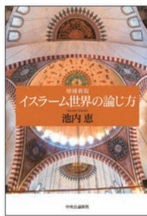
2 『増補新版 イスラム世界の論じ方』