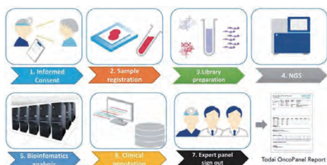
1) がんゲノムプロファイリング cancer genome profiling

We are working with systems biology and medicine to understand complex biological systems through a functional genomics approach. High throughput technology and novel algorithms are required for collecting, integrating, and visualizing the enormous amount of data on gene expression, protein expression, and protein interactions.