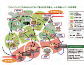
2 コミュニティリビングによる郊外住宅地の 再生（東急電鉄、横浜市とともに） Rebirth of Suburban Area with Community Living Approach