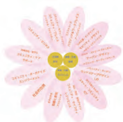
1 様々な分野を統合し共創する コミュニティのデザインとマネジメント Integrated approach for Co-creative Community Design and Management

This laboratory also develops research activities in collaboration with local governments, companies, NPOs and general associations.